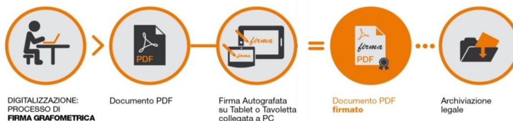
Fig.2 - Schema

I dati cifrati vengono successivamente inseriti nel pdf attraverso la creazione di una firma conforme allo standard europeo denominato PAdES. La soluzione prevede che, a sigillo di ogni firma apposta sul documento dal CLIENTE, sia applicato un certificato rilasciato da NAMIRIAL CA.