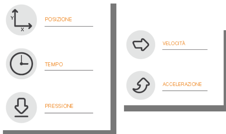
Fig.1 - Schema

Gli elementi disponibili nell'apposizione della sottoscrizione da parte del FIRMATARIO , sono i dati biometrici e comportamentali, quali: Posizione della penna, Pressione, Tratto in aria (percorso che fa la penna quando non tocca nel device, fino a 1cm ), e Tempo. E' possibile elaborare velocità e accelerazione ai fini di analisi forensi.